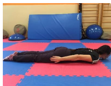
Ľah na bruchu