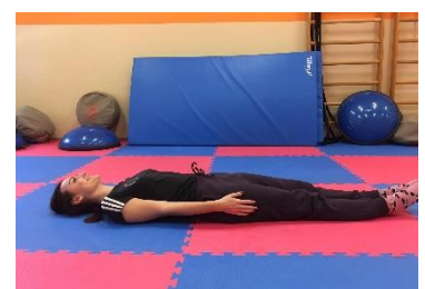
Ľah na chrbte